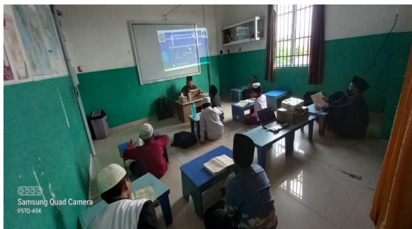
Gambar 1. Kegiatan Pembelajaran Alqur'an dan Halaqoh