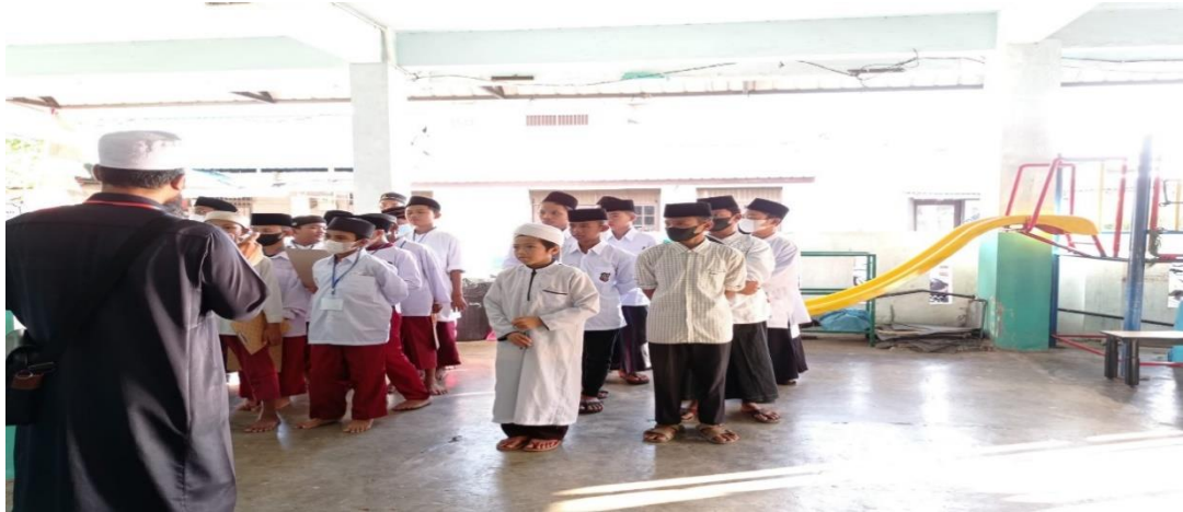
Gambar 2. Ceramah Sebelum Pembelajaran