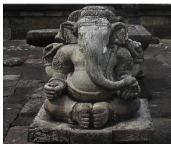
Gambar 3. Arca Ganesha

Dalam ajaran Buddha, arca menggambarkan sosok Buddha dalam berbagai sikap (mudra) serta tokoh suci lain seperti Bodhisattwa, Avalokitesvara, dan Tara. Fungsi arca dalam ajaran Buddha umumnya sebagai objek meditasi atau penghormatan spiritual. Beberapa contoh Arca Buddha antara lain; Arca Buddha Dipangkara, ditemukan di Candi Borobudur, menggambarkan Buddha sebelum kelahiran terakhirnya sebagai Sidharta Gautama. Arca Bodhisattwa Avalokitesvara, merupakan tokoh penting dalam aliran Mahayana. Arca Tara, di temukan di Candi Kalasan, menggambarkan dewi pelindung dalam ajaran Buddha Mahayana. Arca pada masa Hindu-Buddha tidak hanya indah secara artistik, tetapi juga mengandung makna simbolis dan ajaran moral, seperti perlindungan, kebijaksanaan, keberanian, atau kasih sayang (Kartika 2014).