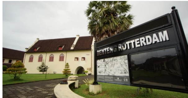
Gambar 10. Benteng Rotterdam

Bangunan ini dibangun untuk kepentingan militer dan pertahanan penjajah dari serangan musuh atau pemberontakan rakyat. Beberapa bangunan tersebut antara lain; Benteng Rotterdam di Makassar (peninggalan Belanda), Benteng Vastenburg di Surakarta, Benteng Fort Oranje di Ternate (peninggalan Portugis dan Belanda), Benteng Marlborough di Bengkulu (peninggalan Inggris).