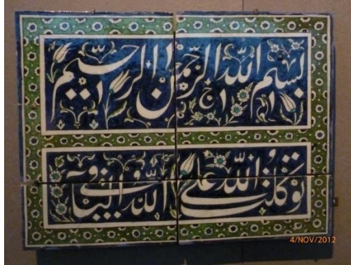
Gambar 8. Contoh Gambar Kaligrafi

Seni kaligrafi Arab sering ditemukan di masjid, nisan, dan dinding bangunan. Selain sebagai hiasan, kaligrafi ini juga menunjukkan nilai keagamaan yang kuat dalam masyarakat Islam.