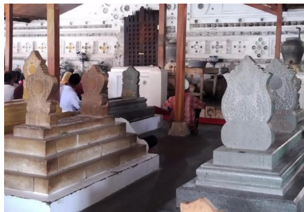
Gambar 6. Makam Sunan Gunung Jati

Makam tokoh-tokoh Islam sering dihormati dan dijadikan tempat ziarah. Ciri khasnya adalah adanya kaligrafi Arab pada nisan. Contoh: Makam Sunan Gunung Jati (Cirebon), Makam Sunan Ampel (Surabaya), Makam Sultan Malik al-Saleh (Samudra Pasai).