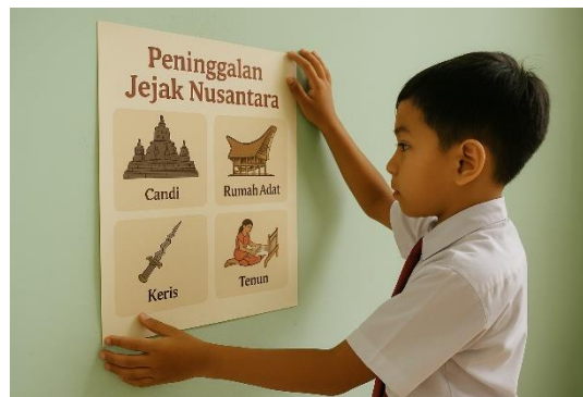
Gambar 15. Praktik nyata di kelas

Dari beberapa penjelasan yang telah dipaparkan diatas, pemateri menyimpulkan beberapa pelajaran penting terkait peninggalan sejarah di Indonesia dalam pembelajaran IPS untuk kelas V SD. Beberapa pelajaran penting tersebut antara lain;