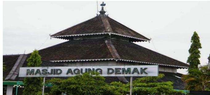
Gambar 5. Masjid Agung Demak

Masjid merupakan peninggalan paling khas dari masa Islam, berfungsi sebagai tempat ibadah sekaligus pusat kegiatan sosial dan pendidikan. Beberapa contoh masjid bersejarah adalah: Masjid Agung Demak (Jawa Tengah), didirikan oleh Wali Songo. Masjid Raya Baiturrahman (Aceh), simbol kejayaan Kesultanan Aceh. Masjid Menara Kudus (Jawa Tengah), unik karena memadukan arsitektur Hindu-Buddha dengan Islam.