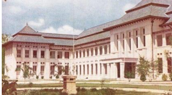
Gambar 13. Gedung STOVIA

Pemerintah kolonial mendirikan sekolah, meskipun awalnya hanya untuk kalangan bangsawan atau orang Belanda. Beberapa sekolah dan Lembaga Pendidikan yang dibangun Belanda antara lain; STOVIA (School tot Opleiding van Indische Artsen), sekolah kedokteran untuk pribumi, ELS, HIS, MULO, dan sekolah-sekolah lain dengan sistem pendidikan Belanda.