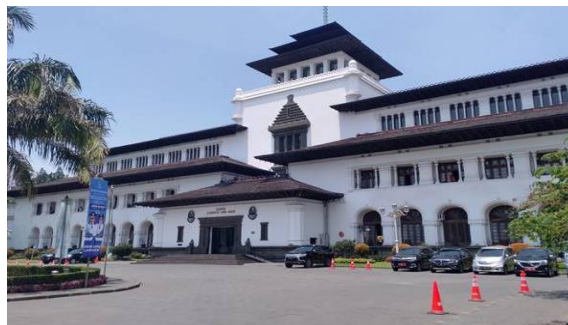
Gambar 11. Gedung Sate

Penjajah membangun gedung-gedung administrasi untuk mengelola pemerintahan kolonial. Beberapa gedung-gedung tersebut antara lain; Istana Gubernur Jenderal (sekarang Istana Merdeka dan Istana Negara), Gedung Sate di Bandung (peninggalan Belanda), Stasiun kereta api tua, jalan raya, dan rel kereta yang digunakan untuk eksploitasi sumber daya.