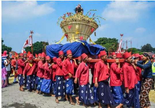
Gambar 9. Tradisi Perayaan Sekaten

Banyak adat dan tradisi lokal yang mengalami akulturasi dengan Islam, seperti: Tradisi Sekaten di Yogyakarta dan Surakarta (peringatan Maulid Nabi), Upacara Grebeg (perayaan hari besar Islam oleh Kesultanan).