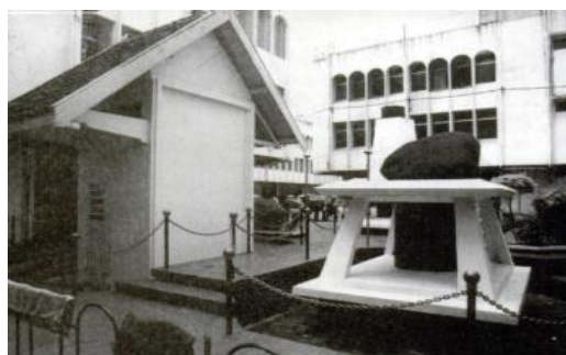
Gambar 12. Penjara Banceuy

Digunakan untuk menghukum para pejuang dan rakyat yang melawan penjajahan. Beberapa bangunan tersebut antara lain; Penjara Banceuy dan Penjara Sukamiskin di Bandung, Kamp tahanan Jepang selama pendudukan Jepang, Penjara Glodok di Jakarta.