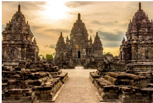
Gambar 1. Candi Prambanan

Candi peninggalan Hindu di Indonesia antara lain; Candi Prambanan di Yogyakarta, Candi Penataran di Blitar, Jawa Timur, dan Candi Dieng di Wonosobo, Jawa Tengah. Sementara Candi peninggalan Buddha antara lain; Candi Borobudur di Magelang, Jawa Tengah, Candi Mendut di Magelang, dan Candi Sewu di yang berada dekat dengan Prambanan (Purnomo 2019).