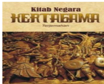
Gambar 4. Karya sastra Negarakertagama.

Karya sastra dan kitab kuno peninggalan Hindu-Buddha adalah tulisan atau naskah yang lahir pada masa ketika pengaruh agama Hindu dan Buddha berkembang di Nusantara, terutama antara abad ke-4 hingga abad ke-15 Masehi. Karya-karya ini memiliki nilai historis, religius, dan budaya yang sangat penting karena mencerminkan kehidupan masyarakat, sistem kepercayaan, serta nilai-nilai yang dijunjung pada masa itu (Sartika 2022). Banyak karya sastra yang ditulis dalam bentuk kakawin atau kidung yang memuat ajaran moral, keagamaan atau sejarah kerajaan. Contoh beberapa karya sastra peninggalan Hindu-Buddha antara lain; Negarakertagama yang dibuat oleh Mpu Prapanca pada masa kerajaan Majapahit. Arjunawiwaha karya Mpu Kanwa, dan Sutasoma karya Mpu Tantular, dangan ajaran Bhinneka Tunggal Ika.