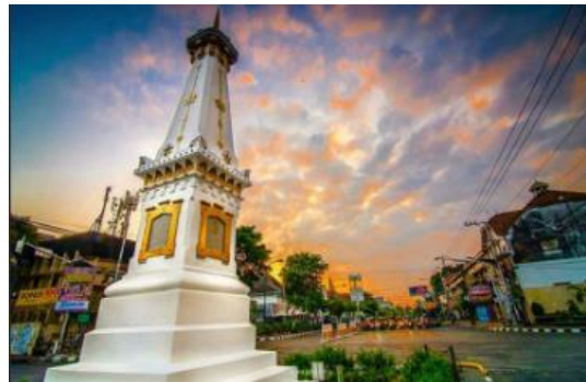
Gambar 14. Tugu Pal Putih

Beberapa Tugu atau Monumen didirikan oleh penjajah untuk memperingati peristiwa penting atau tokoh kolonial. Contohnya adalah Tugu Pal Putih di Yogyakarta (meskipun kemudian dijadikan simbol perjuangan), dan Monumen peninggalan Belanda di kota-kota besar.