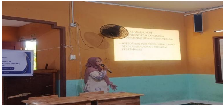
Gambar 3. Penyampaian Materi Kedua tentang Manajemen Kelas Ramah Anak