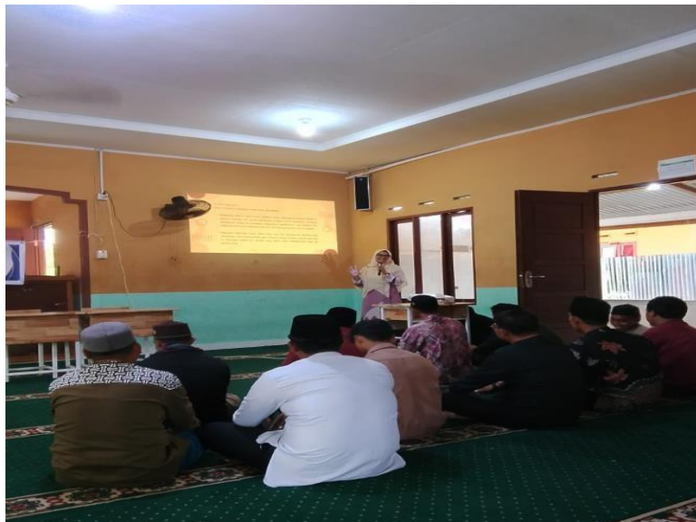
Gambar 4. Pelaksanaan Kegiatan di Ponpes Muatiara Qur'an Boarding School (MQBS) Bengkalis

Sebelumnya pemahaman guru tentang perilaku misbehave masih rendah, padahal sehari-hari guru sebenarnya menghadapi perilaku misbehave namun levelnya ringan. Perbandingan hasil dapat dilihat dalam tabel hasil pre test dan post test. Kondisi tersebut menunjukkan, setelah dilakukan sosialisasi guru menjadi memahami tingkatan/level perilaku misbehave, faktor yang mempengaruhi perilaku misbehave, dampak perilaku misbehave, dan manajemen kelas ramah anak sebagai strategi pencegahan perilaku misbehave siswa. Partisipasi guru dalam sosialisasi ini menunjukkan semangat, antusias guru dalam bertanya kepada pemateri cukup banyak. Pemahaman yang diperoleh dapat mengantarkan guru pada suatu keterampilan mengelola kelas dan dapat meningkatkan kepekaan terhadap perilaku misbehave siswa.