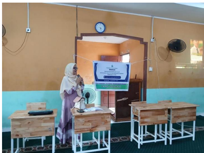
Gambar 2. Penyampaian Materi Pertama tentang Perilaku Misbehave Siswa