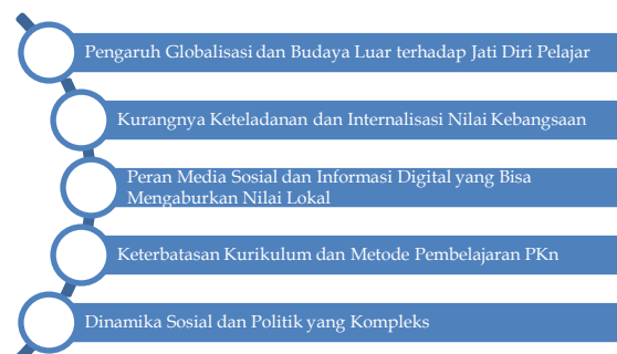
Gambar 1. Tantangan Pembentukan Identitas Nasional Pada Pendidikan Kewarganegaraan