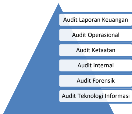
Gambar 1. Tabel Jenis-Jenis Audit Manajemen Keuangan

Ada 6 jenis Auditing dalam manajemen keuangan, yaitu: